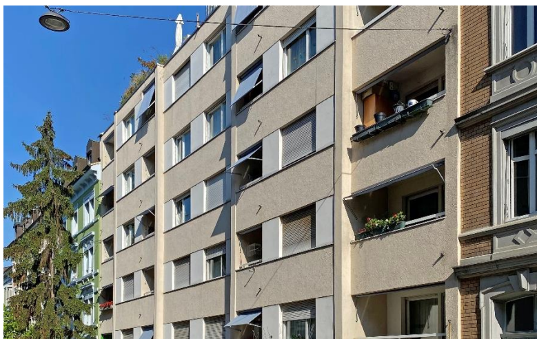
MFH Oetlingerstrasse 153/155 Basel