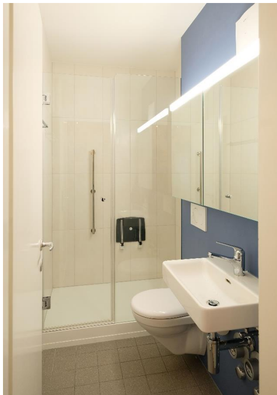
Saniertes Bad Typ Decora