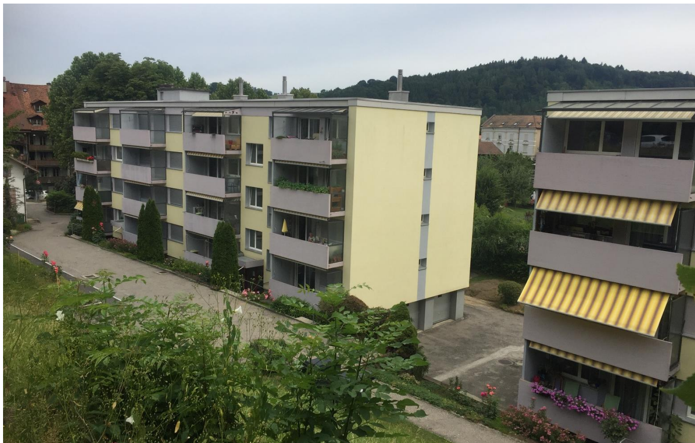
Haldenweg 1-7 Burgdorf