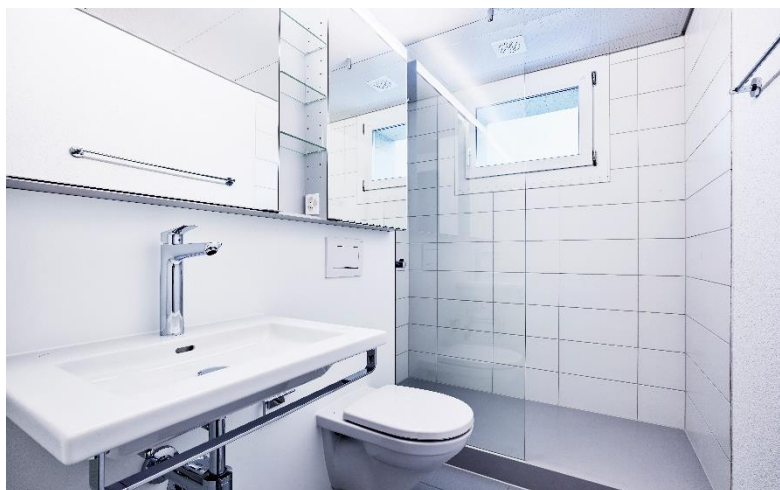
Bad Haldenweg neu