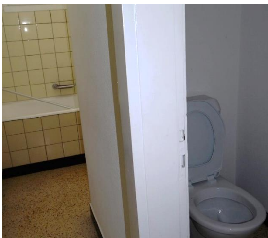
Bad Haldenweg alt